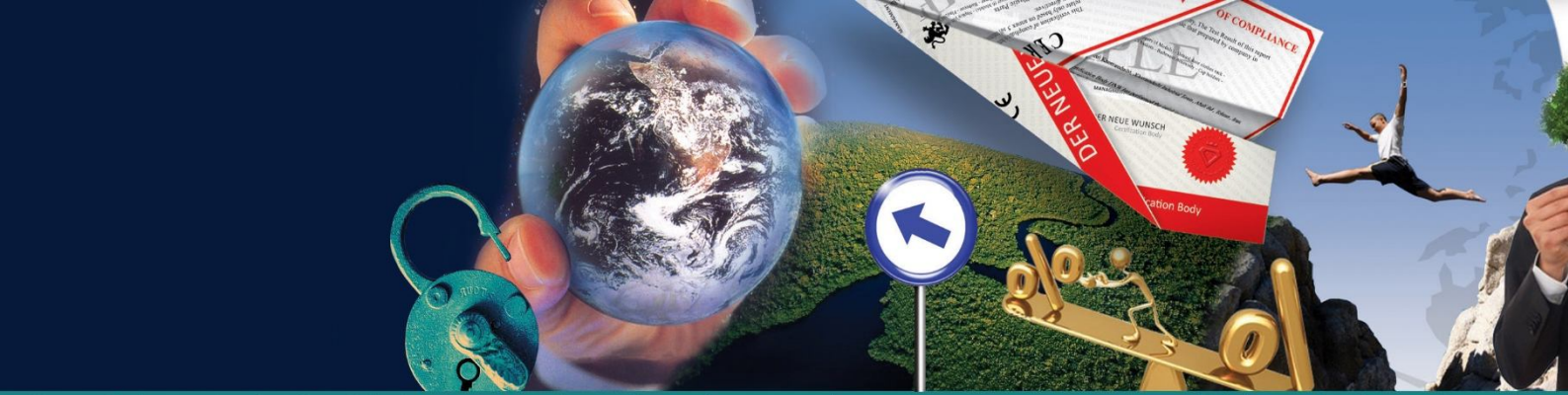
Use of the standards aids in the creation of products and services that are safe, reliable and of good quality